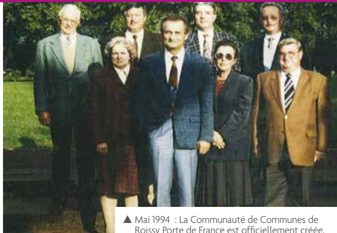
▲ Mai 1994 : La Communauté de Communes de Roissy Porte de France est officiellement créée.