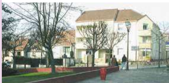
▲ Rue Dorval, en 1977 et aujourd'hui