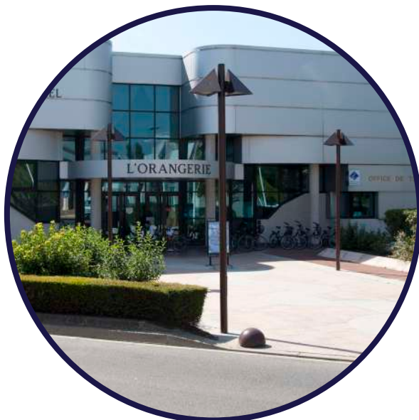
OFFICE DE TOURISME GRAND ROISSY